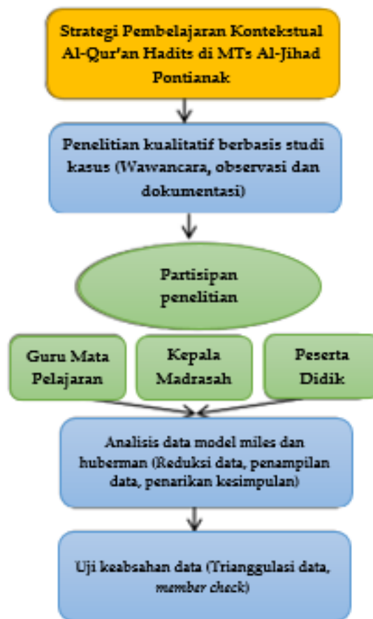
Bagan 1. Alur Penelitian

Analisis data dalam penelitian ini menggunakan model Miles dan Huberman, yang terdiri dari beberapa tahapan, yakni pengumpulan data, reduksi data, penampilan data, dan penarikan simpulan. Untuk menjaga keabsahan data yang diperoleh maka uji keabsahan data dilakukan melalui triangulasi data, dan member crosscheck. Untuk lebih detailnya rancangan penelitian ini di uraikan dalam bentuk Bagan Penelitian sebagai berikut: